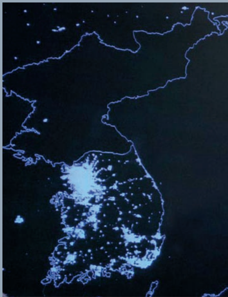
▶ แผนที่ประเทศเกาหลีใต้และประเทศเกาหลีเหนือที่ถ่ายจากดาวเทียมในเวลากลางคืน