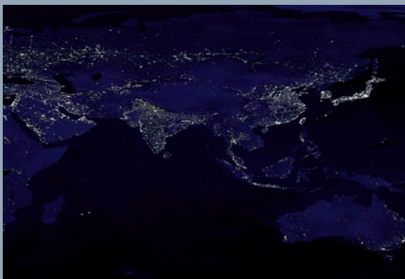
▶ ประเทศไทยในเวลากลางคืน เปรียบเทียบกับประเทศต่างๆ ในเอเชีย