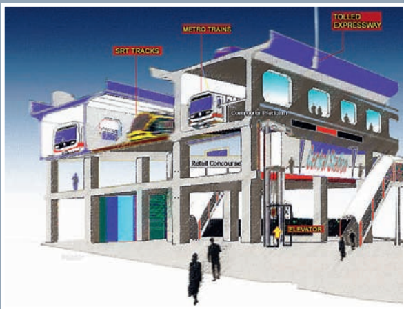
▣ โครงการ Hopewell ถ้าไม่ทุจริต