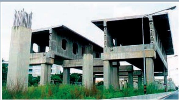
▣ โครงการ Hopewell ที่เป็นจริง

ในวงการอสังหาริมทรัพย์ และวงการก่อสร้าง เรารับรู้ความจริงที่ว่าเมื่อใดประชาชนมีรายได้ดี มีความร่ำรวย งานการก่อสร้างก็จะมีมาก ทั้งการก่อสร้างบ้านที่อยู่อาศัย ไปจนถึงการสร้างอาคารสูงเพื่ออยู่อาศัยด้วย ธุรกิจการก่อสร้างจะโตมากหรือโตน้อยในแต่ละปีจึงขึ้นอยู่กับ การเพิ่มขึ้นของรายได้ของประชากรของประเทศไทยอย่าง แน่นนอน แต่บางครั้งประเทศไทยร่ำรวยแต่คนไทยไม่รวย ตามไปด้วยก็มีเป็นประจำ เพราะเงินถูกนำไปสร้างสิ่งที่ไร้ ประโยชน์ หรือเป็นโครงการดี ที่โกงกันจนไม่เสร็จเหลือแต่ ซาก เช่น โครงการรถไฟฟ้า Hopewell เป็นต้น